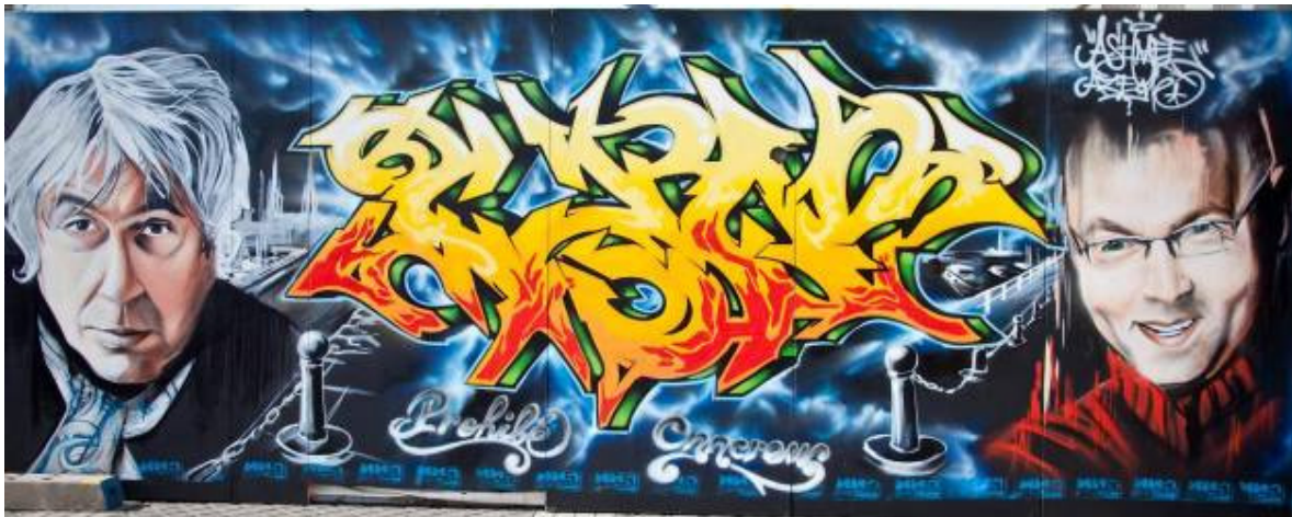
Graffiti realisatie tijdens TAZ#2009

Arno: Vandaar ook de idee om Brussel naar Oostende te brengen. Echte Brusselaars, dat bestaat niet. Brussel is een 'stoemp', een 'melting pot' van verschillende culturen. Oostende is ook zo, maar anders.