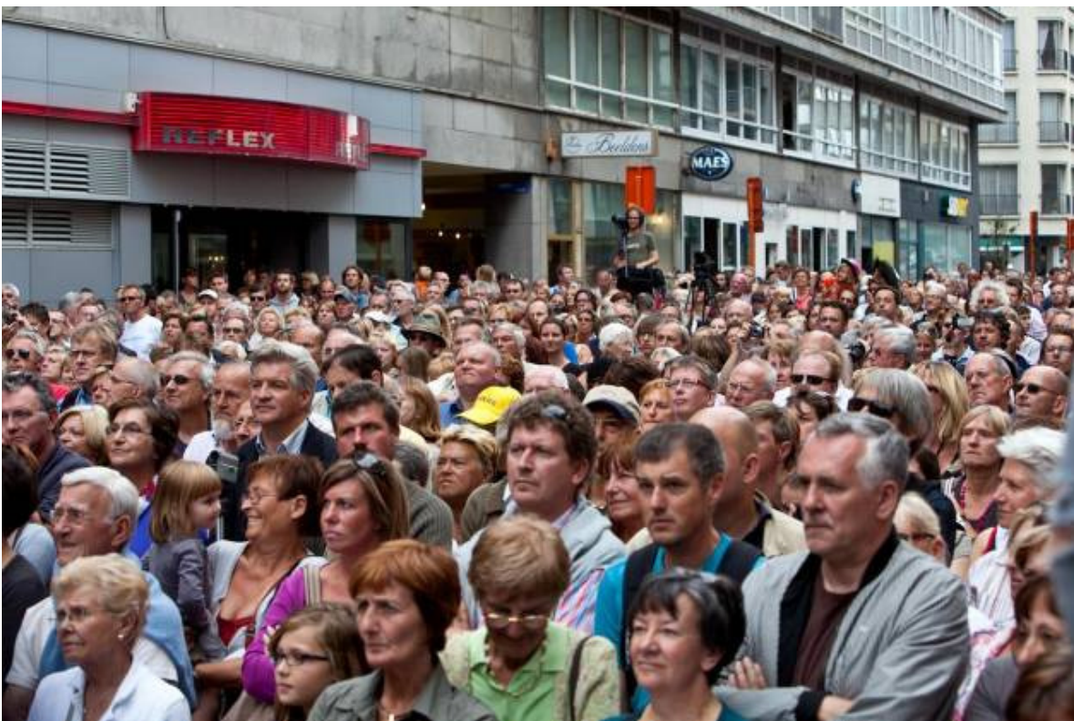
Publiek tijdens de ode aan James Ensor en Bob Dylan met het wandtapijt van Ensors 'De Intocht van Christus te Brussel' op de achtergrond van het concert.

Vanzelfsprekend worden ook de Brusselse kunstopleidingen (P.A.R.T.S., RITS, INSAS e.a.) op de voet gevolgd.