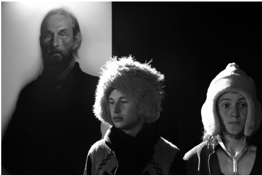
De Drie Zusters van De Bühnehasen