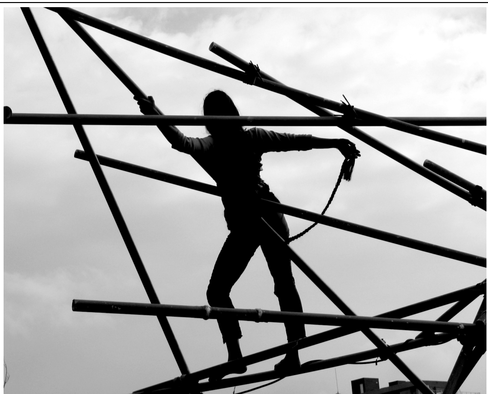
De Zuid-Franse spektakelgroep Iltopie aan het werk op het Stationsplein