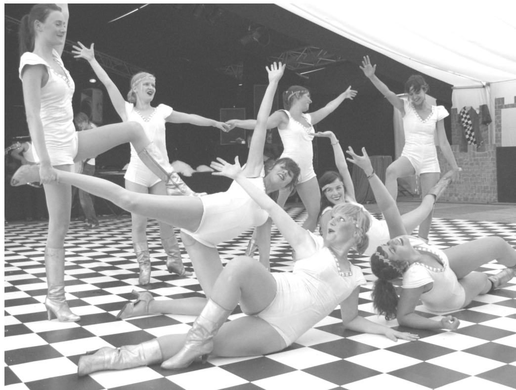
Fanfare Schoon Vertier met majorettes op het dambord in Café Koer