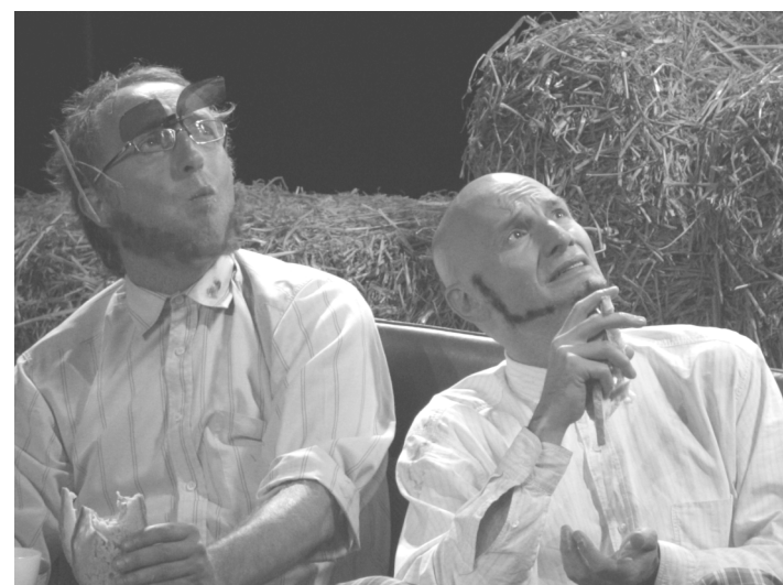
De Gebiologeerden van De Koe