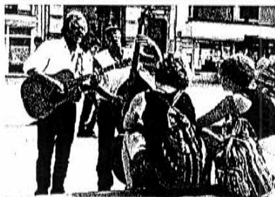
Muppet Stuff aan het werk op de dijk. Rechtstreekse confrontatie met de luisteraar, die wordt afgezonderd en bijna fysisch geconfronteerd met de muziek. Hun thema: 'I believe in music'.

M.L.: De improvisatie op straat en strand is uiteraard de beste reclame voor 'de binnenspektakels'. We krijgen nu te maken