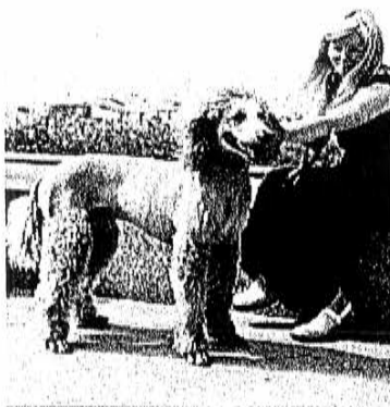
Sommige wezens voeren een straat-act op zonder het zelf te beseffen. Deze gecoiffeerde woef stond echt niet in de TaZ-programmatie!

met festivalitis: mensen die van hier naar daar rondcrossen en het dan nog jammer vinden dat ze niet alles hebben kunnen meepikken. Maar ja, dat is nu eenmaal eigen aan een festival met een goed voorzien programma. Trouwens, de uitbreiding werd ook gezien in het kader van de praktijkervaring van de