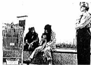
De groep 'Inspirazie' verkleed als landlopers en rijkswachters, waren bepaald overtuigd in hun act. De 'clochards' kregen zelfs geld toegegooid van argeloze kijkers. Let wel: ze hebben het achteraf netjes teruggegeven.

M.L.: Een deel van hen hebben we gecontacteerd via de vzw Trefpunt van Gent die o.m. de Gentse Feesten organiseert. We zijn ook zelf naar een beurs getrokken en persoonlijk heb ik de verschillende theaterscholen aangeschreven. De mond-aan-mond reclame doet de rest. Zo zijn er ondertussen artiesten van Brugge naar hier afgezakt omdat ze vernemen dat er hier meer volk is.