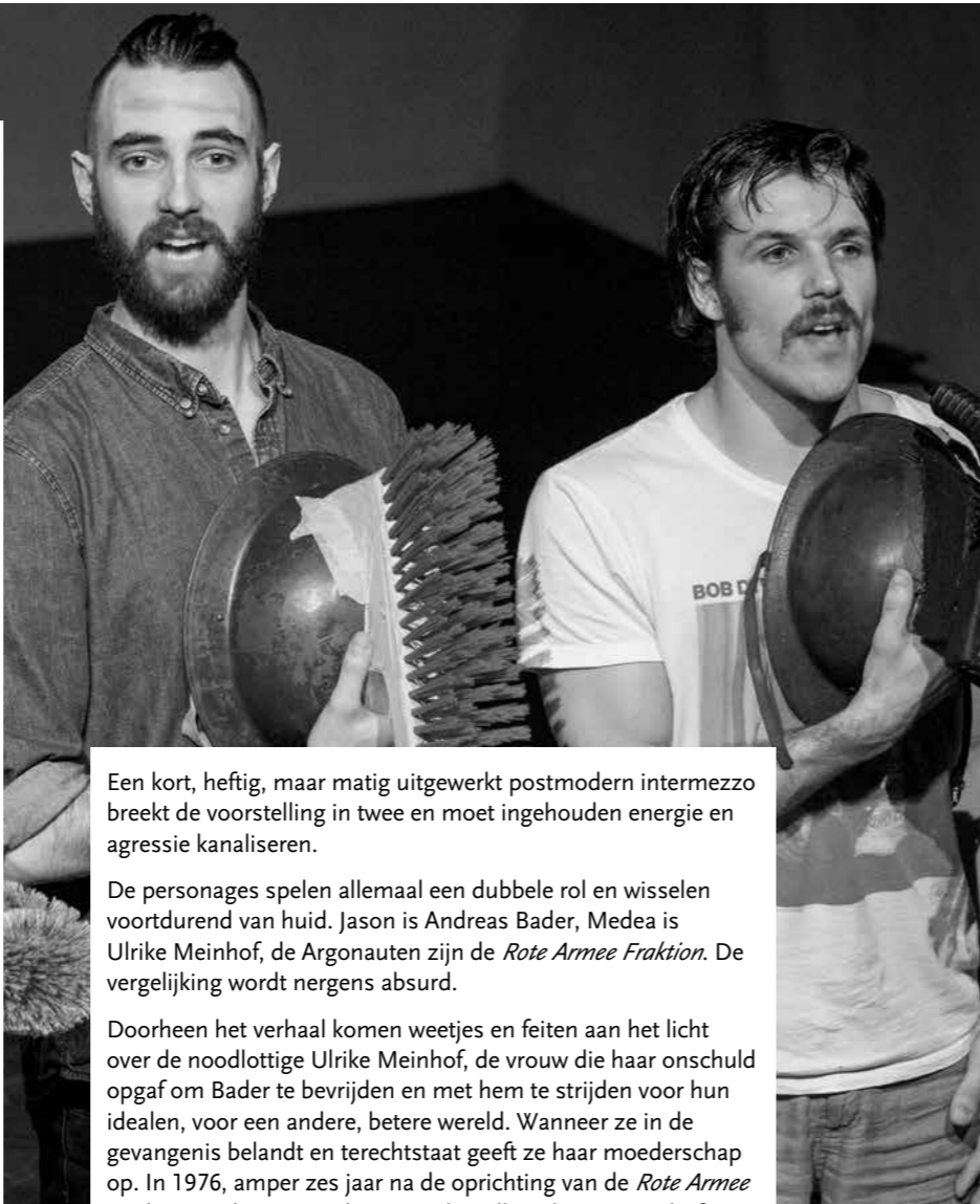
De Meinhof/Medea (of hoe steek ik een Ikea meubel in elkaar binnen de aangegeven tijd, gespeeld door de eerste generatie Rote Armee Fraktion tijdens hun opsluiting in de Stuttgart-Stammheim gevangenis, gezien door de ogen van Ulrike Meinhof)

De op het eerste gezicht wat flauwe humor (Abba als wapen - Zweeds design bestrijden met Zweedse muziek - en de interpraties van kleffe kerstliedjes) leggen een laag van ongerijmdheid die niet gaat irriteren, maar dynamiek en energie vrijmaakt in een verder vrij lineair opgebouwd verhaal.